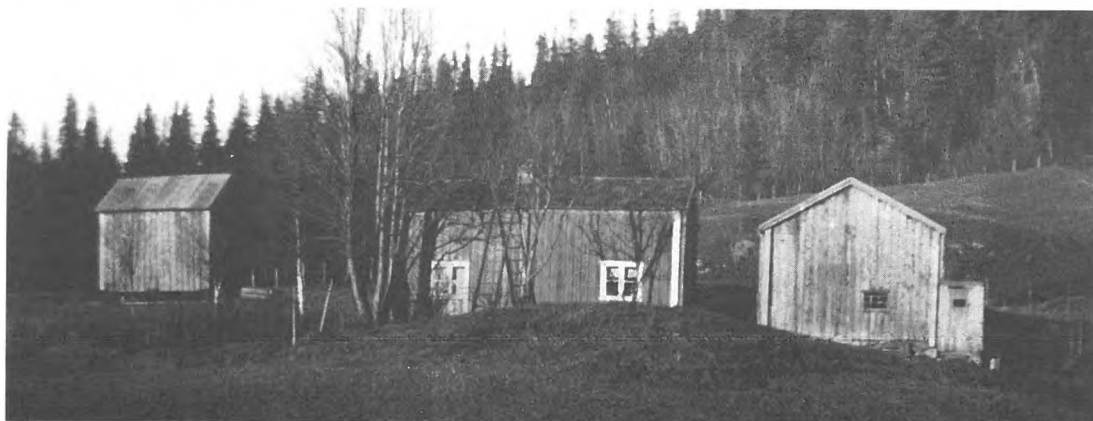
Marenstu i 1945