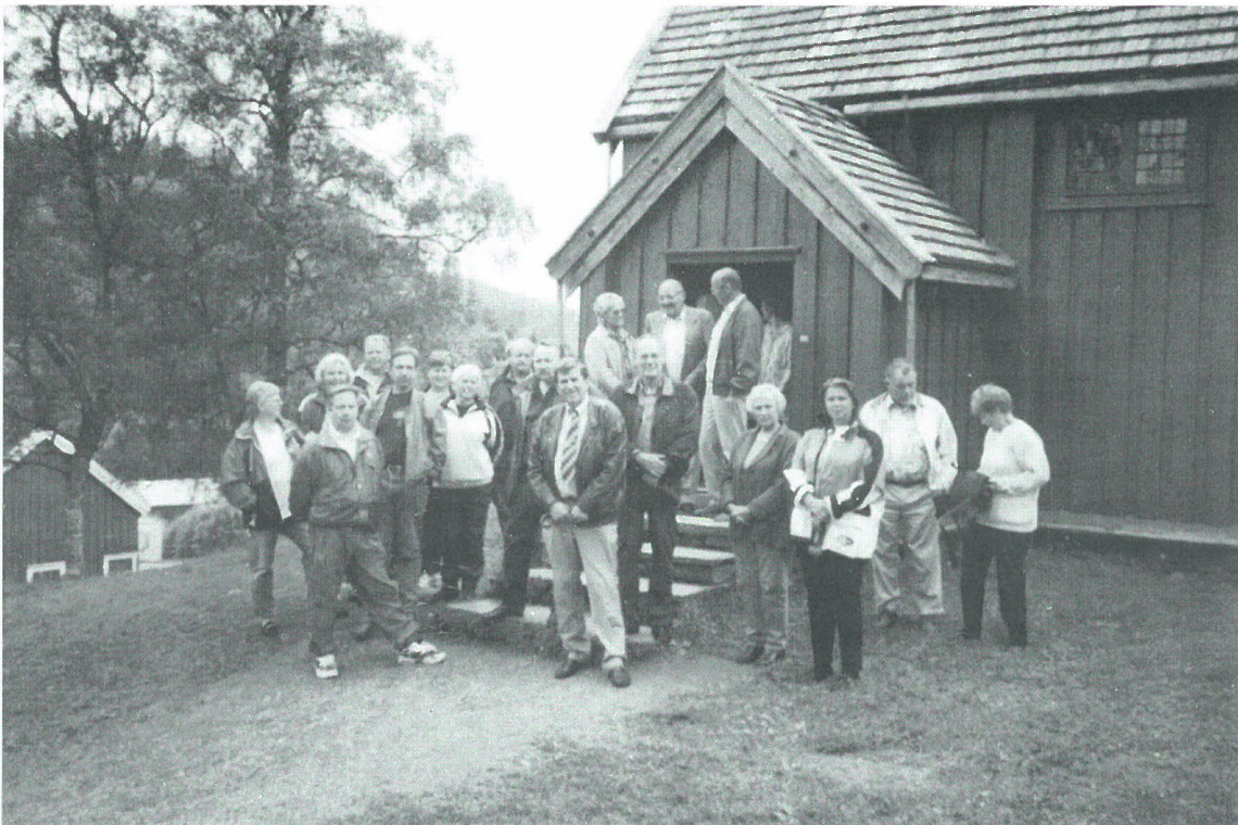
En del av deltagerne samlet foran Loe stavkirke

Videre gikk vi over i byavdelingen med bl.a. Skimuseet med sine store samlinger av utstyr og premier som våre "gamle"trønderske topputøvere hadde samlet. Vi så også innom flere forskjellige kontorer, bl.a. lege og tannlege med sine "torturinstrumenter". Takk og pris at utviklingen av instrumenter har fjernet oss langt fra disse sakene.