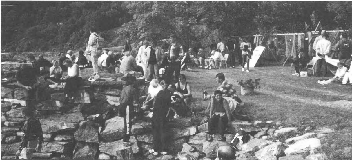
Folk koser seg med kaffen i godværet

Gjestene, nærmere 100 i tallet, storkoste seg i det kjempefine været, var levende interresserte i utstillingen, spurte, og fortalte selv om sjøliv og fiske, og hadde historier både på skjemt og alvor.