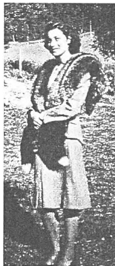
Betzy i fin stas