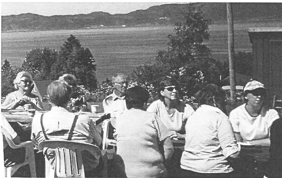
Stemninger fra turene (side 6 og 7)