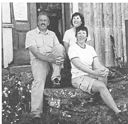
Søsknene Klemetsaune på trappa i kolonihagen.

sett arbeidet i museumssektoren, senest som markedssjef ved Norsk Skogmuseum på Elverum.