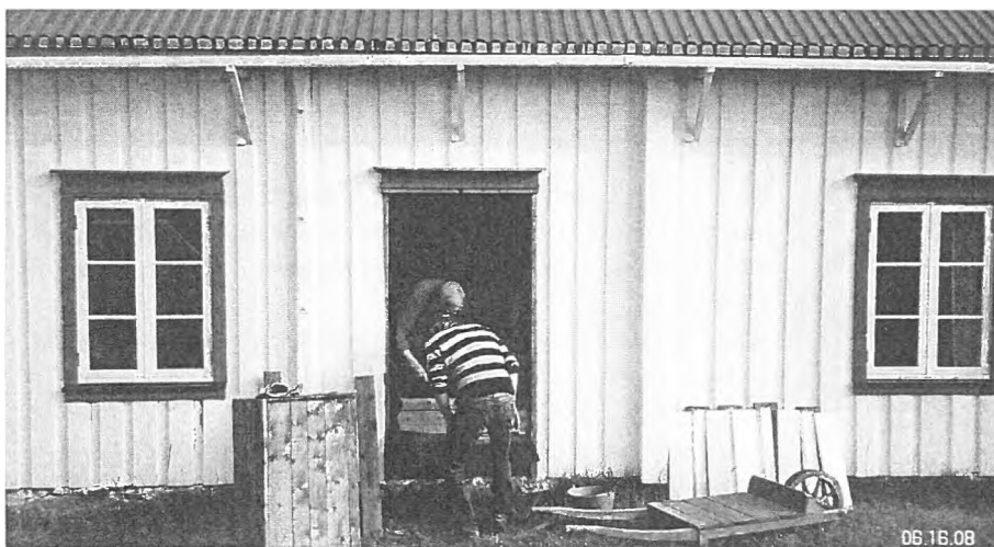
Utbedring av råteskader i "butikkdøråpning" før montering av nytt vindu.

De fikk oppleve et gripende foredrag v/ Knut Olav Åsegg om tidligere bosettere på plassen. ▶