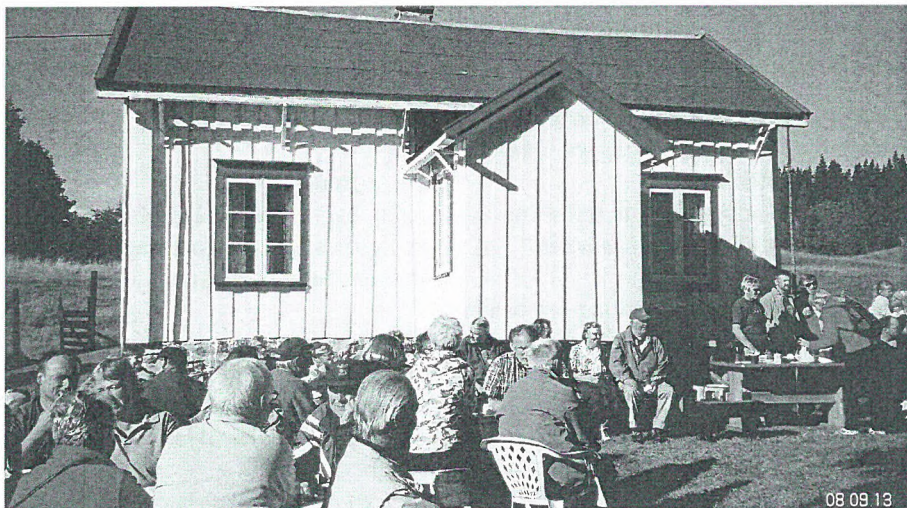
Fra Åpen dag i Onsøyhåggån.