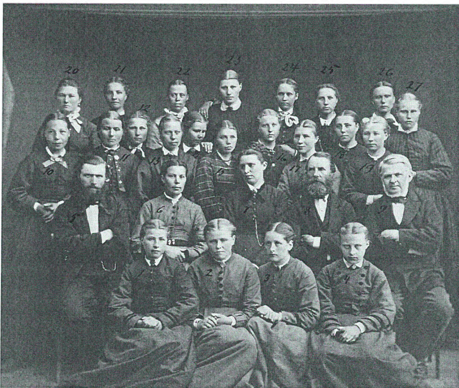
Gjentehøgskulen på Mula på Bynesse om somaren 1876.