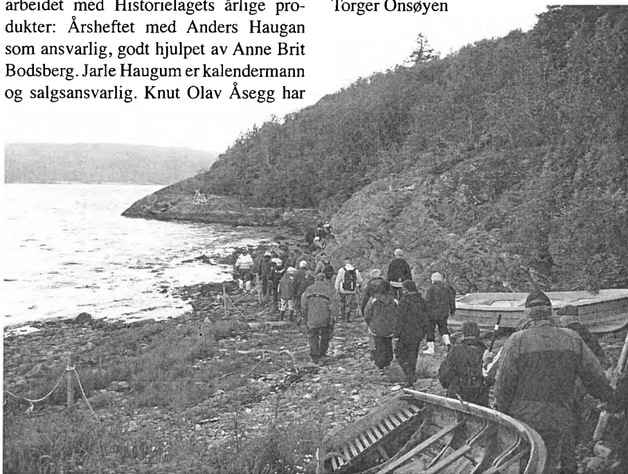
Historisk vandring fra Vevik til Hangerskjæret 2008