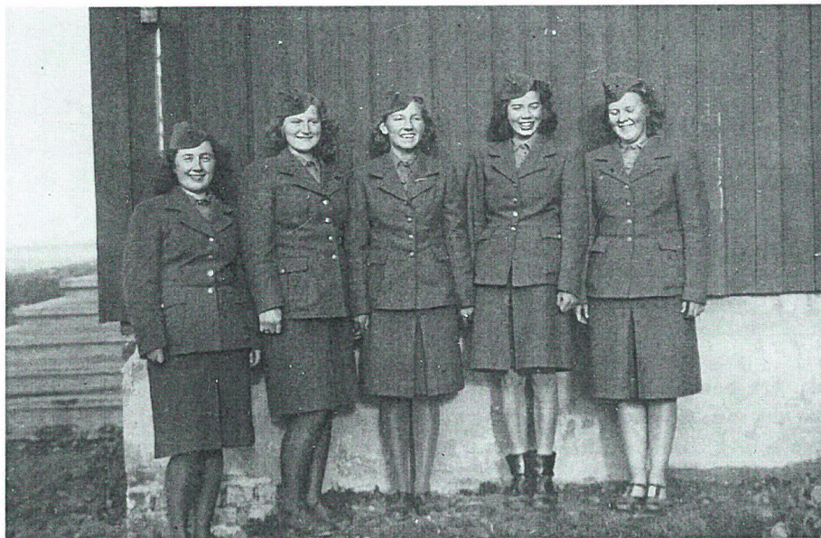
Klar for helgepermisjon

På en gård på Hangersletta måtte gårdskona dra ut i et ærend, og tok seg den frihet å bruke jentene som barnepassere. Da hadde hun laget vaffelrøre og ba dem steike og spise så mye de ville. Dette var et stort lyspunkt i hverdagen.