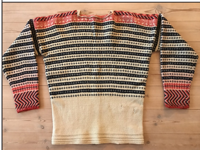
Bynestrøya over ble strikket ca. 1860 til Lars Gudmundson Rye.